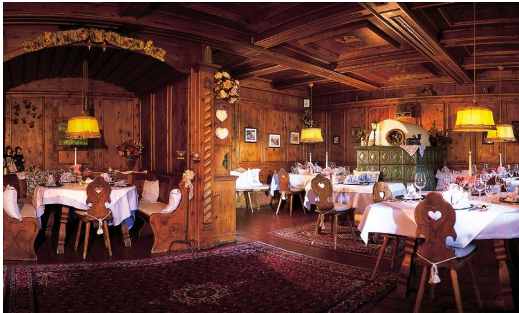
Echte tirolerische Gastlichkeit: Im Familienbetrieb „Furtners Lebensfreude Hotel“ strahlen die Räume wohlige Wärme aus, die Stuben eine heimelige Atmosphäre.

Gesicherte Qualität ist dem Hotelier vor allem in Zeiten der vielen Lebensmittelskandale ein wichtiges Anliegen: „Die Gäste sind froh, wenn sie wissen, woher die Produkte stammen. Bei uns wird sehr offensiv mit dem Thema umgegangen.“