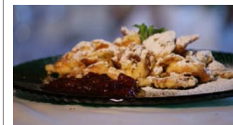
Kaiserschmarrn mit Milchprodukten aus Tirol.

Petra Oberhäuser aus Schwaig: „Herzlichen Dank nochmal für die schönen Tage und das super-leckere Essen. Wir haben das wirklich sehr genossen.“